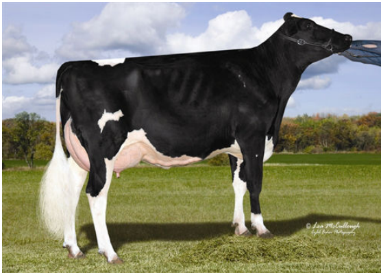
COOKIECUTTER MOM HALO GRANDDAM